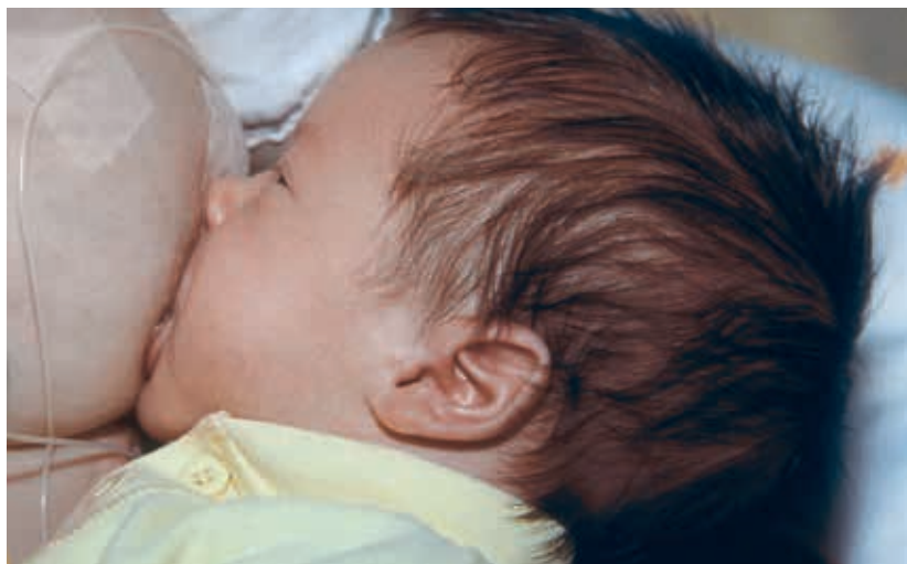
Intensives Saugen an der Brust und gleichzeitig Zufütterung durch einen Schlauch

Die wichtigsten praktischen Hinweise, um mit dem Brusternährungsset (BES) während des Stillens zuzufüttern. Márta Guóth-Gumberger