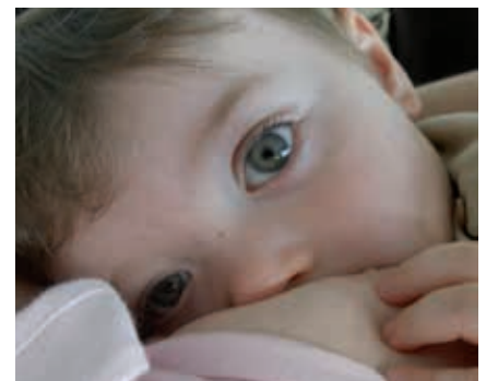
Entspannt an der Brust, nachdem mit dem BES das volle Stillen wieder erreicht wurde

Ausführliche Beratung ist beim Einsatz des BES am Anfang und zum Dranbleiben essenziell. Viele Mütter erreichen nach der Anwendung des Brusternährungssets das ausschließliche Stillen. Andere reduzieren den Einsatz des BES nach Einführung von fester Kost. Auch bei geringer Milchbildung ist es möglich, später ohne ein Hilfsmittel zu stillen. Zu Beginn ist die Situation in der Regel belastet und häufig sind Wochen später Mutter und Baby entspannt und freuen sich am Stillen.