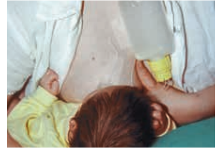
Stillen mit dem BES in Seitenhaltung