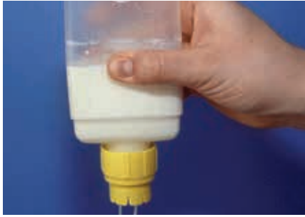
Beim Drücken auf den Behälter sollte die Milch im Strahl fließen.