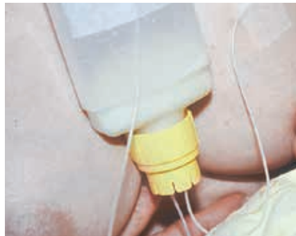
Beide Schläuche offen – schnellerer Fluss

Die Fließgeschwindigkeit wird langsamer, wenn der 2. Schlauch geschlossen ist, bei dünnerem Schlauch, tiefer hängendem Behälter oder kühlerer Milch.