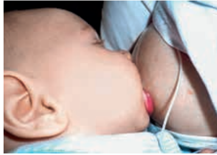
Viel Brustgewebe im Mund bedeutet mehr Milchtransfer und mehr Stimulation der Brust.