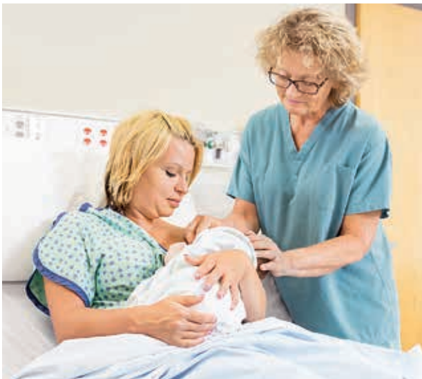
Die Ubbo-Emmius-Klinik sucht Verstärkung für ihr Team.